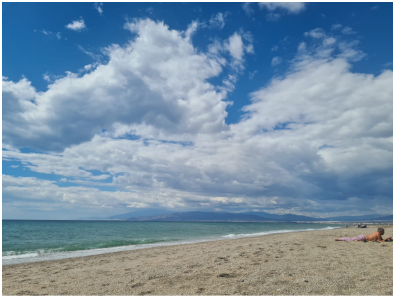
↑ PUEBLO DE CABO DE GATA