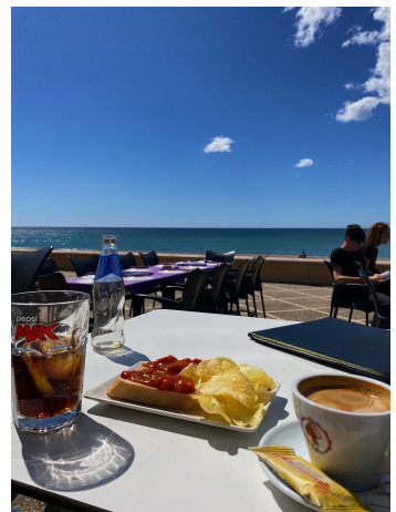
↘ CHIRINGUITO (Strandbar)