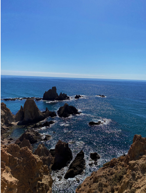
EL FARO DE CABO DE GATA