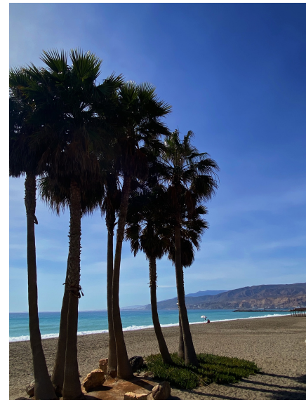
PLAYA DE ALMERÍA