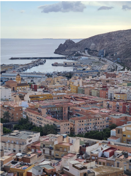
← Ausblick über Almería