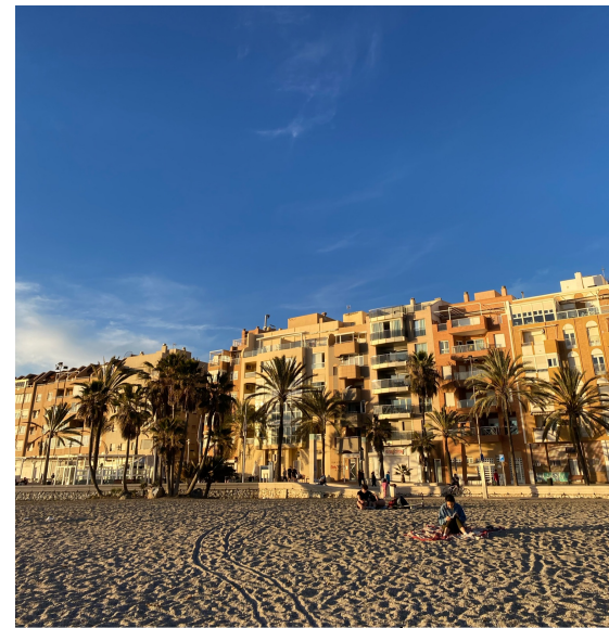
EL PASEO MARÍTIMO