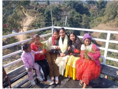
Ein Bild vom Klassenausflug

Da die Schüler*innen bereits ab der ersten Klasse jeden Tag English Unterricht haben, funktionierte die Kommunikation während des Unterrichts besser als gedacht. Ich hatte auch den Eindruck, als wären die nepalesischen Schüler*innen motivierter als die Deutschen, dies kann aber auch daran liegen, dass ich der erste Freiwilliger an dieser Grundschule war und dementsprechend die Kinder sich mir gegenüber anders verhielten.