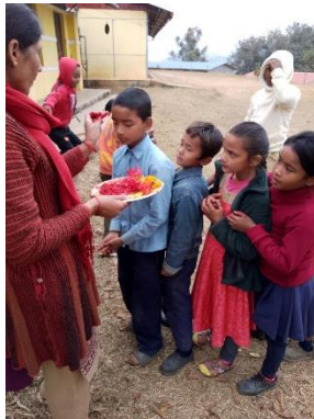
Zeromonie während der Einschulung

War die Sprachbarriere nicht ein großes Problem, so stellte die ärmliche Ausstattung der Schule insbesondere bei sportlichen Aktivitäten meine Improvisationsfähigkeit auf die die Probe.