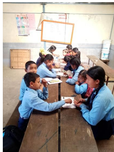
Schüler*innen während des Unterrichts