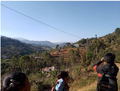
Aussicht über Narbanda

Das Freiwilligenprojekt wird in ein soziales Netzwerk eingebunden, damit beide Seiten profitieren. Ein Koch wurde angestellt, eine nepalesische Lehrerin bringt den Freiwilligen ein paar Wörter der Landessprache bei und an dem freien Tag der Woche bietet ein Guide kleine Tageswanderungen im Umkreis an.