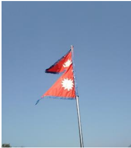
Flagge von Nepal

Als ich aus der trubeligen, aufregenden Hauptstadt in die ruhige und ländliche Gegend meines Praktikumsortes gekommen bin, hatte ich zuerst kurz Bedenken, dass ich nun von Allem abgeschnitten, isoliert meine Zeit absitzen muss. Dies stellte sich aber glücklicherweise als Irrtum heraus.