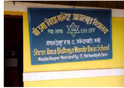
Name der Schule in Nepali

Sowohl die innere Haltung sich in dem Dorf zu engagieren und aktiv zu versuchen am sozialen Leben teilzunehmen als auch die sehr aufgeschlossene Art der Bewohner*innen vor Ort, waren die beiden entscheidenden Gründe, für meine Integration in die Dorfstruktur.