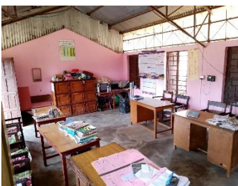
Einblick in ein Klassenzimmer

Die Shree Uma Bidaya Mandir Basic School ist eine öffentliche Grundschule mit ca. 50 Schüler*innen und 5 Lehrkräfte. Es sind also sehr kleine Klassen, in denen ich den Eindruck hatte, dass eine gute individuelle Betreuung geleistet wird. Die Beziehung zwischen Schüler*in und Lehrkraft zeichnete sich durch Nähe und hohem gegenseitigem Respekt