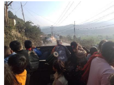
Eine Klasse geht auf Reisen

Darüber hinaus durfte ich an der örtlichen Yogaklasse teilnehmen und war hin und wieder bei dem informellen Volleyballtreff. Häufig