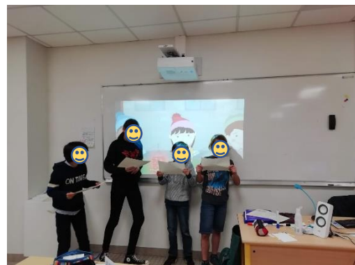
IM ATELIER ALLEMAND SINGEN EIN PAAR SCHÜLERINNEN UND SCHÜLER DAS JAHRESZEITENLIED AUF DEUTSCH.