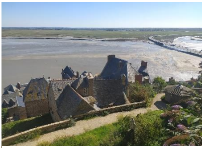
DER MONT SAINT-MICHEL VON OBEN.