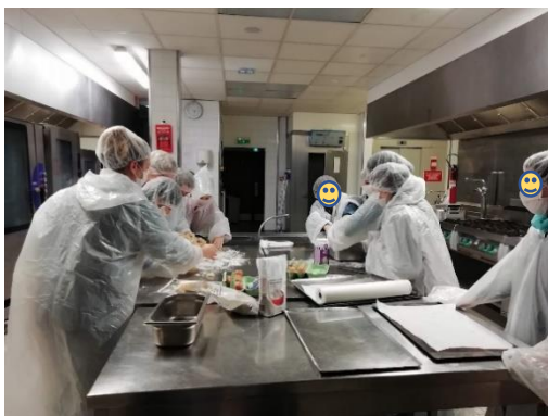
DIE SCHÜLERINNEN UND SCHÜLER DES ATELIER ALLEMAND BACKEN IN DER GROBKÜCHE DER SCHULE WEIHNACHTSPLÄTZCHEN.

Da Deutsch als sehr schwere Fremdsprache angesehen wird und immer weniger Schülerinnen und Schüler Deutsch wählen, dient die AG auch ein bisschen dazu, Werbung für die deutsche Sprache zu machen und zu zeigen, dass es einige Gemeinsamkeiten zwischen dem deutschen und englischen Vokabular gibt. Die Schülerinnen und Schüler der siebten Klasse haben schon ab diesem Schuljahr Deutsch als Unterrichtsfach und können deshalb schon ein bisschen mehr als die Sechstklässlerinnen und Sechstklässler. Für sie dient die AG also eher als Vertiefung und daher war es manchmal herausfordernd, den verschiedenen Niveaus gerecht zu werden.