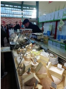
MARCHE DES LICES.

Und ansonsten muss man unbedingt die bretonischen Spezialitäten Galettes und Cidre probieren! Bei Galettes handelt es sich um herzhaftere Crêpes aus Buchweizenmehl, die beispielsweise mit Champignons, Spiegelei und Käse gefüllt sind.