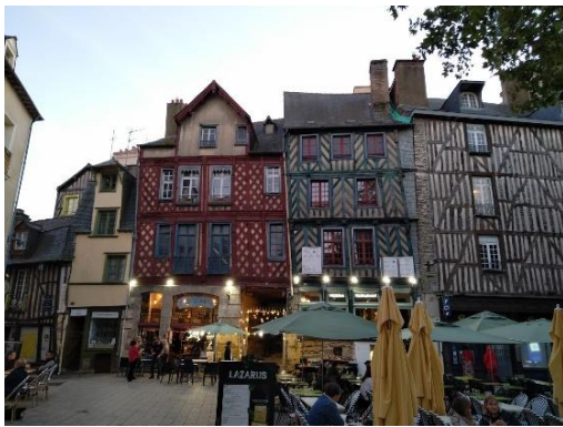
LA PLACE SAINTE ANNE IN RENNES MIT VIELEN SCHÖNEN FACHWERKHÄUSERN.

Rennes ist eine schöne, lebendige Stadt mitten in der Bretagne. Die Altstadt zeichnet sich durch Fachwerkhäuser, gepflasterte Straßen und kleine Kneipen aus. In den warmen Monaten sitzen abends viele Menschen draußen vor den Bars auf den Plätzen und genießen ihr Getränk in der Abendsonne. Durch Rennes fließt die Vilaine, ein kleiner Fluss, an dessen Ufer man gut joggen oder spazieren gehen kann. Außerdem ist die Infrastruktur innerhalb Rennes gut, es gibt zwei Metrolinien und diverse Busse, sodass es nicht so lange dauert, von A nach B zu kommen. Die Fahrradwege in Rennes sind auch nicht schlecht, da es im Winter aber viel regnet, braucht man gute Regenkleidung.