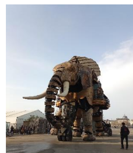
DER ELEFANT IN NANTES.

Ich habe in einer Vierer-WG im Süden von Rennes gewohnt und die Zeit dort sehr genossen. Da meine WG direkt an der Metrostation war, konnte ich gut nach der Schule nochmal ins Zentrum fahren, um Sport zu machen, mal mit meiner WG ins Kino oder in eine Bar zu gehen. Am Wochenende haben wir öfters Ausflüge in der Umgebung von Rennes gemacht, weil die Bretagne sehr viel zu bieten hat. Mit dem Zug kann man in einer Stunde bis an den Atlantik fahren und es gibt viele schöne Küstenorte zu entdecken. So lohnt sich ein Tagesausflug zum Mont Saint-Michel, nach Saint Malo oder Dinard und es gibt sowohl Sandstrände als auch Steilküsten zu sehen. Außerdem ist Nantes nicht sehr weit von Rennes entfernt; dort kann man sich beispielsweise die beeindruckenden Machines de l'île (große Maschinen z.B. in Form eines Elefanten, der läuft und Wasser aus seinem Rüssel spritzt) anschauen.