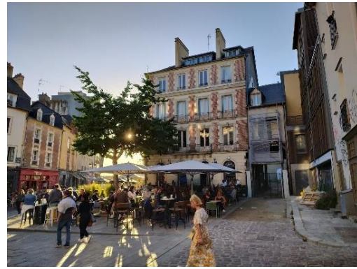
RENNES INNENSTADT MIT RESTAURANTS UND BARS.