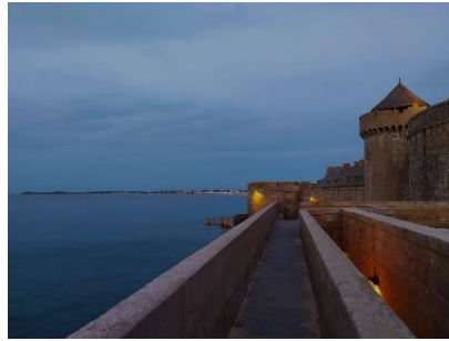
DIE PROMENADE VON SAINT MALO.