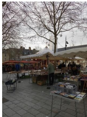
BÜCHERMARKT IN RENNES.