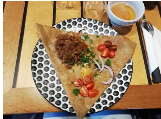
GALETTE UND CIDRE.