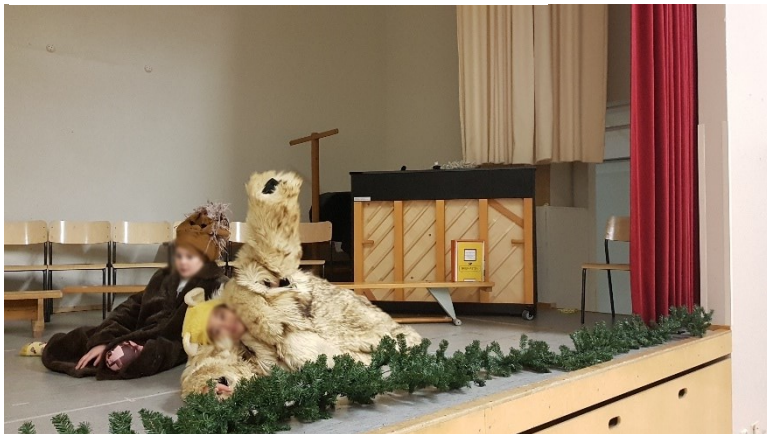
Viertklässler:innen üben ein Theaterstück ein.