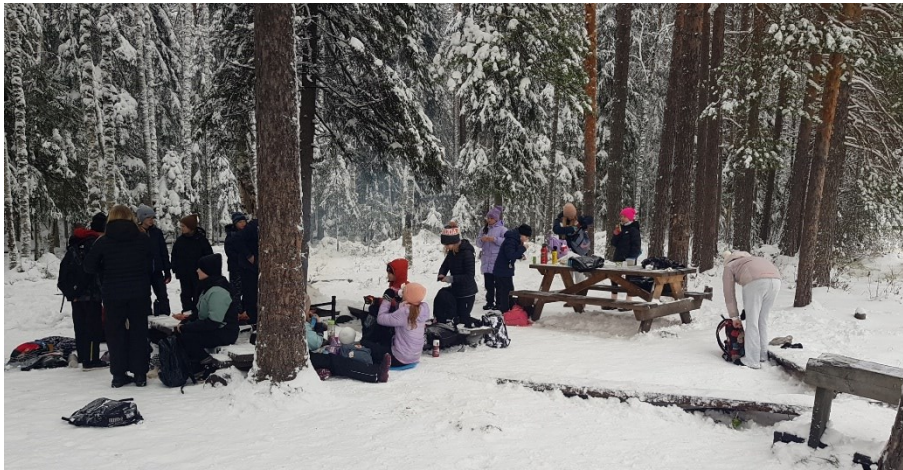
Schulausflug mit dem fünften Jahrgang.

Da die anderen Fächer logischerweise auf Finnisch unterrichtet werden, fällt es teilweise schwer zu folgen. Allerdings waren die Lehrkräfte super offen und hilfsbereit und haben mir geduldig alle meine Fragen beantwortet. Auch kann es hilfreich sein, Bilder von Aufgaben o. Ä. zu machen und sich diese zu übersetzen (z.B. mit der Funktion vom Google-Übersetzer, hilft auch bei der Unterrichtsvorbereitung). Neben meinen Studienfächern habe ich mir auch das Kreativangebot an der Schule angesehen und in den anderen Fremdsprachenunterricht reingeschaut, um diesen mit dem Deutschunterricht zu vergleichen (hat auch den Vorteil, dass man dort mehr versteht – zumindest, wenn man die Sprache selbst gelernt hat 😊).