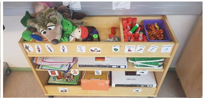
Ausschnitt: Materialien im Deutschraum.