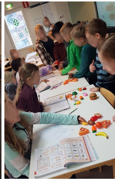
Unterrichtsstunde zum Thema "Essen".

Während meines Aufenthaltes gab es zahlreiche saisonale Ereignisse, die teilweise in der ganzen Schule zelebriert wurden (z.B. Halloween) und die sich für besondere Unterrichtsstunden angeboten haben. So haben wir zum Beispiel mit den Grundschüler:innen Laternen gebastelt und ich habe den Nikolaus gespielt (auf diese Weise konnten die Kinder auch etwas über deutsche Traditionen lernen). Da die Lehrpläne mit weniger Vorgaben einhergehen (das war zumindest meine Erfahrung), konnten auch spontan besondere Stunden eingebaut oder sich mehr beziehungsweise weniger Zeit für ein Thema genommen werden. Das ging mit einer erhöhten Flexibilität einher, sodass wir vor Weihnachten zum Beispiel die Zeit hatten, mit den Viertklässlern ein kleines Theaterstück auf Deutsch einzuüben.