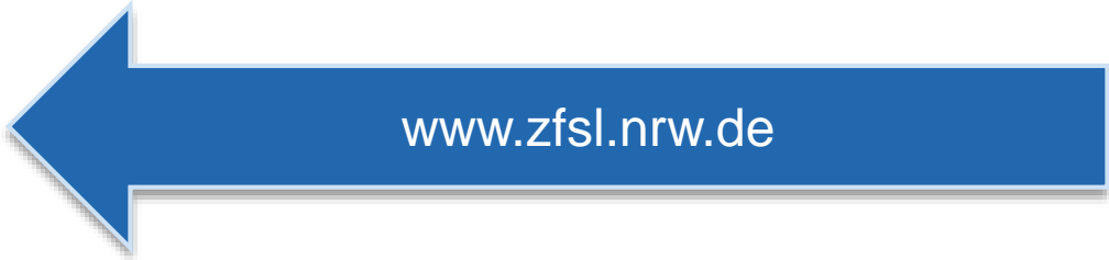
Titel der Präsentation